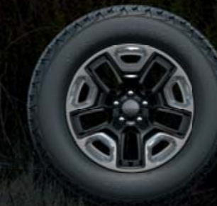
ΒΑΜΜΕΝΕΣ/ΓΥΑΛΙΣΤΕΡΕΣ ΖΑΝΤΕΣ ΑΛΟΥΜΙΝΙΟΥ 17" Βασικός εξοπλισμός