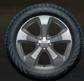
ΒΑΜΜΕΝΕΣ ΖΑΝΤΕΣ ΑΛΟΥΜΙΝΙΟΥ 18" Βασικός εξοπλισμός