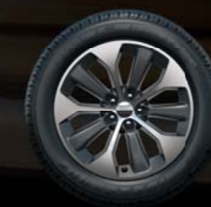
ΣΤΙΛΒΩΜΕΝΕΣ ΖΑΝΤΕΣ ΑΛΟΥΜΙΝΙΟΥ 19" Βασικός εξοπλισμός