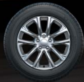
ΒΑΜΜΕΝΕΣ ΖΑΝΤΕΣ ΑΛΟΥΜΙΝΙΟΥ 17" Διαθέσιμο