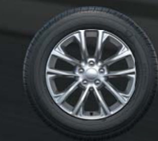
ΒΑΜΜΕΝΕΣ ΖΑΝΤΕΣ ΑΛΟΥΜΙΝΙΟΥ 17" Βασικός εξοπλισμός