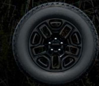
ΒΑΜΜΕΝΕΣ ΜΑΥΡΕΣ ΖΑΝΤΕΣ ΑΛΟΥΜΙΝΙΟΥ 17" Διαθέσιμο