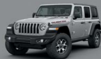
Μεταλλικό ασημί Billet