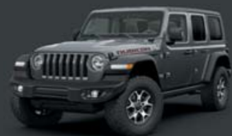
Μεταλλικό Granite Crystal