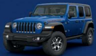
Μεταλλικό μπλε Ocean