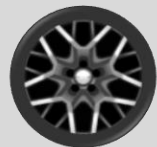
Ζάντες αλουμινίου 18'' με ελαστικά 255/70/R18