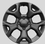
ην επόμενη σελίδα Ζάντες αλουμινίου 16"