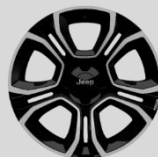
Ζάντες αλουμινίου 18"