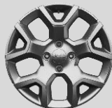
Ζάντες αλουμινίου 17"