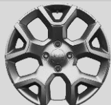
Ζάντες αλουμίνιου 17"