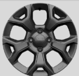
Ζάντες αλουμίνιου 16"